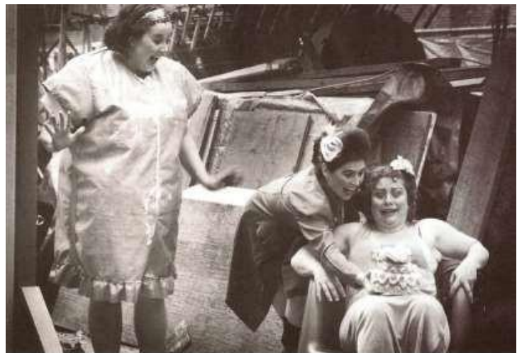
La Grosse , spectacle de la compagnie Toxique Trottoir, présenté dans la cour du sculpteur Armand Vaillancourt à l'occasion du Fringe Montréal 2006.

Toxique Trottoir a la pigère pour le théâtre de rue. Les festivaliers invétérés se rappelleront leur marquant spectacle ambulant les Botero , qu'elles avaient présenté au Festival Juste pour rire et au Festival d'été de Québec en 2004, spectacle qu'elles ont repris au Festival de théâtre de rue de Shawinigan en 2006. La Grosse était présentée dans la cour arrière du sculpteur Armand Vaillancourt; agglutinés contre la clôture, les passants observaient avec curiosité cette expérience théâtrale et musicale singulière.